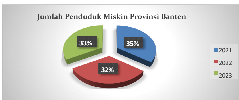
Gambar 1. Persentase Penduduk Miskin Se-Provinsi Banten 2021 s.d. 2023

Dari sekian banyaknya provinsi di Indonesia, Banten menjadi salah satu provinsi yang penduduknya masih mengalami fase kemiskinan bahkan distigmakan sebagai provinsi tidak bahagia (Bernadette & Juliannisa, 2021). Hal demikian ditinjau dari survei Badan Pusat Statistik mengenai jumlah kemiskinan penduduk di Provinsi Banten sepanjang tahun 2021 s.d. 2023 yang menyatakan bahwa Banten masih mengalami situasi perekonomian yang dinamis. Sebab, sepanjang tahun 2021 s.d. 2022 Banten mengalami penurunan jumlah penduduk miskin yakni menyentuh di angka 814,02 ribu jiwa, namun mengalami kenaikan kembali di tahun selanjutnya menjadi 826,13 ribu jiwa. Tentu saja hal demikian menjadi refleksi mendalam, meskipun jumlah kenaikan tersebut tidaklah terlalu banyak.