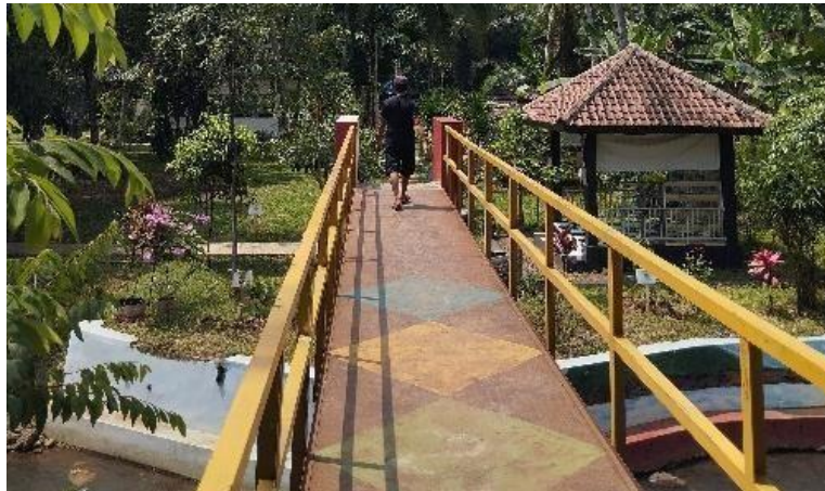
Sumber: (Peneliti, 2024)

Secara pengelolaan, Wisata Kacida Cibuntu yang terletak di Desa Padarincang ini dilakukan oleh Kelompok Sadar Wisata atau Pokdarwis yang telah ditetapkan oleh Kepala Desa Padarincang yakni Bapak Iyus Pariyadi dengan Nomor SK 141.1/SK-10-Ds.Pdr/XI/2021. Dalam menjalankan tugasnya, Pokdarwis bekerja sama dengan berbagai pihak seperti Lembaga Pemberdayaan Masyarakat, Karang Taruna, Kader Posyandu, Tim Penggerak PKK, serta tokoh masyarakat dan tokoh agama. Kerja sama ini memastikan bahwa pengelolaan desa wisata dilakukan secara profesional dan melibatkan semua elemen masyarakat.